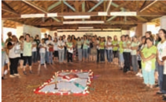
Líderes reunidos em Assembleia.