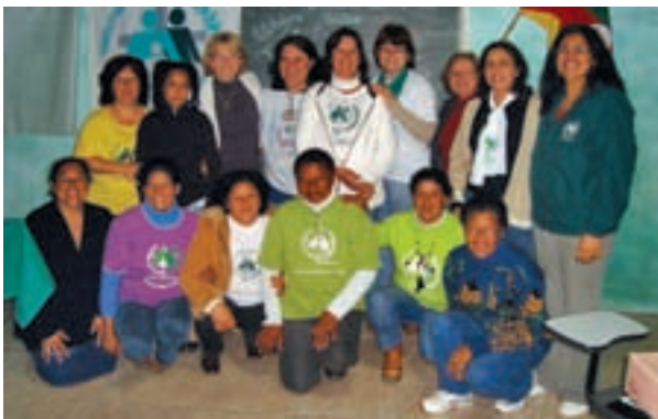
Líderes elegem nova coordenação para o Setor.