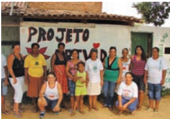
Projeto ArtVida, antiga sede, 2007.

O Projeto Vencer Juntos, iniciado em 2003 pela Pastoral da Criança, e hoje executado pela Fundação Grupo Esquel Brasil, já financiou e acompanha cerca de 500 projetos de geração de renda em dez dioceses do interior da região Nordeste e norte de Minas Gerais. Os principais patrocinadores que viabilizam o Projeto são o Programa Desenvolvimento e Cidadania, da Petrobras e do Governo Federal, e o SEBRAE Nacional. A partir de abril de 2010, informações sobre o Vencer Juntos, os grupos apoiados e seus produtos estarão disponíveis no web site www.vencerjuntos.org.br