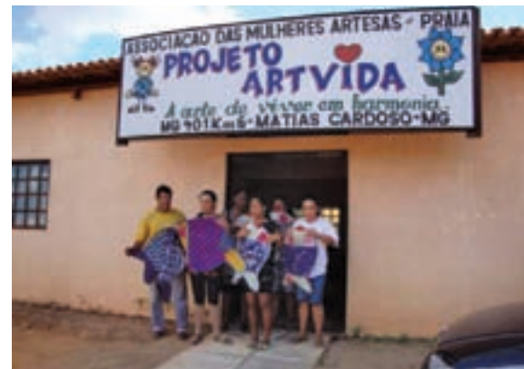
Nova sede da Associação, 2009.