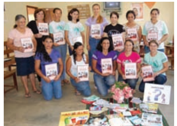
Líderes capacitados sobre Hanseníase.