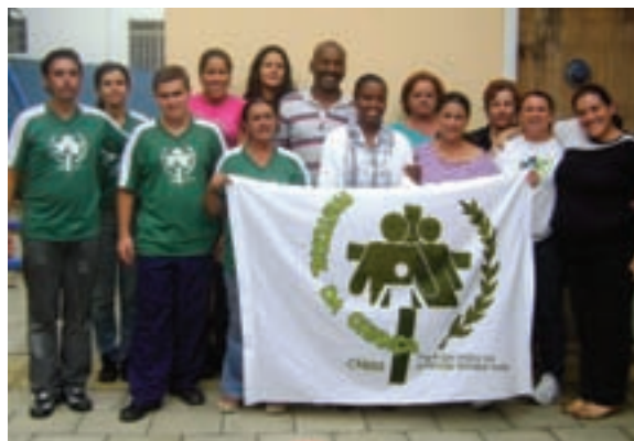
Líderes comemoram expansão da Pastoral da Criança.

Nos dias 27, 28 de Março aconteceu a Capacitação e a Implantação da Pastoral da