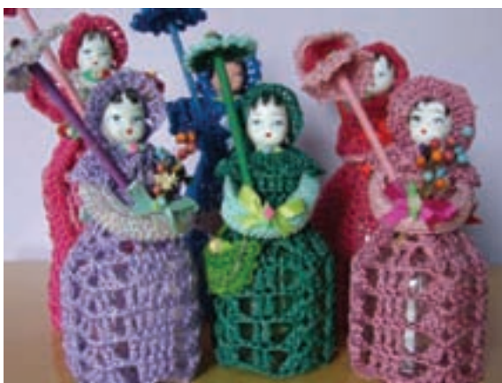
Bonecas de garrafa pet.