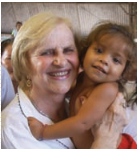
Dra. Zilda Arns Neumann Fundadora e Coordenadora Internacional da Pastoral da Criança. Fundadora e Coordenadora Nacional da Pastoral da Pessoa Idosa. Conselheira do Conselho de Desenvolvimento Econômico e Social da Presidência da República.