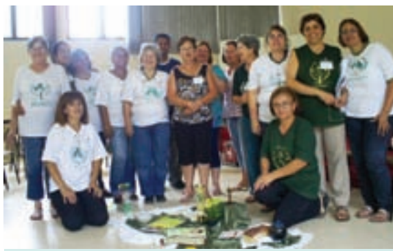
Líderes participam de capacitação em alimentação saudável.

3) foi a hora de todos colocarem a mão na terra, semearam e transplantaram algumas mudas em pequenos vasos.