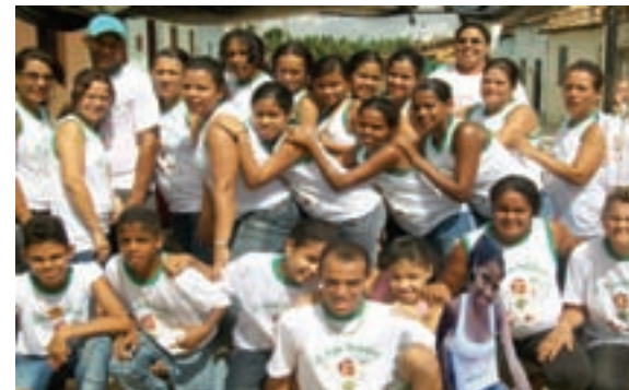
Líderes no encerramento da II Ação Solidária